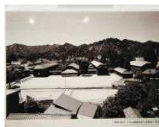
S50 教育会館前の西校

11/7に174回目の開校記念日を迎えました。成器堂から数えて174年になります。お父さんやお母さんを含めたくさんの卒業生と伝統に支えられた西校です。そこで今年は、開校記念日に西校出身の先生に小学生当時のことを聞きました。